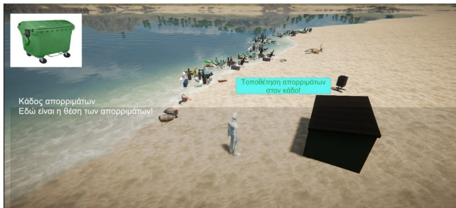
Εικόνα 4. Προβληματισμός και Ενεργοποίηση για την αντιμετώπιση της μόλυνσης από απορρίματα