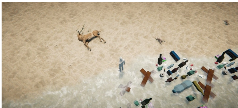
Εικόνα 3. Νεκρά ζώα κοντά στην ακτή

Η ευαισθητοποίηση του χρήστη στα πλαίσια της διάστασης "Εκπαίδευση από και μέσα από το περιβάλλον" επιτυγχάνεται, καθώς σε άλλα σημεία, για παράδειγμα, κοντά στην ακτή εντοπίζονται μαζικά νεκρά ζώα (ελάφια, λαγούς και πάπιες) με τα σχετικά μηνύματα προβληματισμού για τους πιθανούς λόγους αυτού του δυσάρεστου γεγονότος (Εικόνα 3).