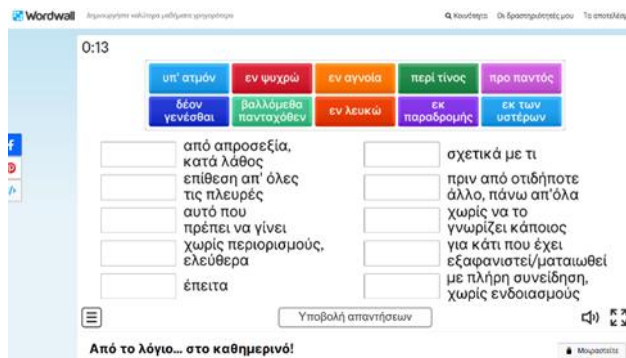
Εικόνα 1. Δείγμα ψηφιακής εφαρμογής Wordwall

το πλαίσιο χρήσης και τη σχέση των λόγων στοιχείων με τα αρχαία ελληνικά. Η δραστηριότητα ολοκληρώνεται με την αξιοποίηση του ψηφιακού περιβάλλοντος Wordwall (Εικόνα 1) για την εμπέδωση των εννοιών. Το δεύτερο διδακτικό δώρο ακολουθεί τη μέθοδο της Ανοιχτής διδασκαλίας (Kalantzis & Cope, 2001), με στόχο την ανάλυση τεσσάρων άρθρων με κοινή θεματολογία σχετικά με τη γλωσσική φθορά και τη χρήση των «greeklish», όπου οι μαθητές/τριες διερευνούν τα γλωσσικά χαρακτηριστικά, τις στάσεις των αρθρογράφων, τα επιχειρήματα και την προσαρμογή τους σε συγκεκριμένα ακροατήρια.